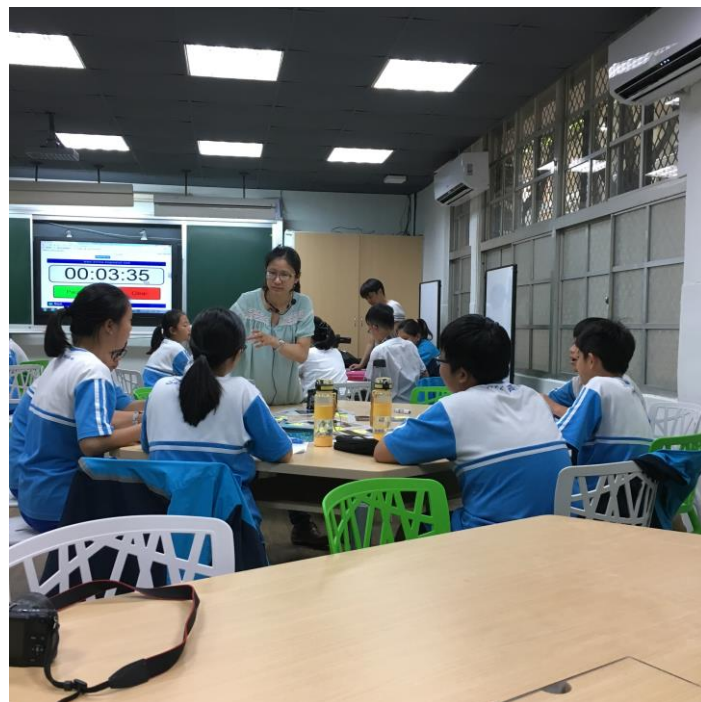
圖二、老師與學生課堂互動