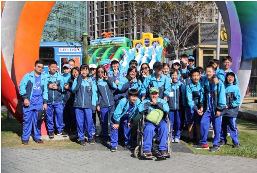
▲116 全體同學於草悟道地標前拍大合照。