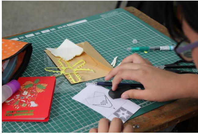
▲同學們作著日本剪紙。