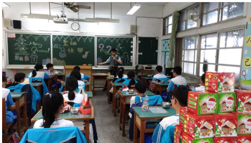
▲我於課堂上拉奏二胡。