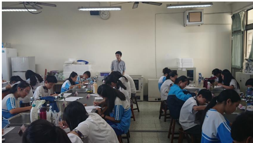
▲協助語文競賽國高中部作文項目。