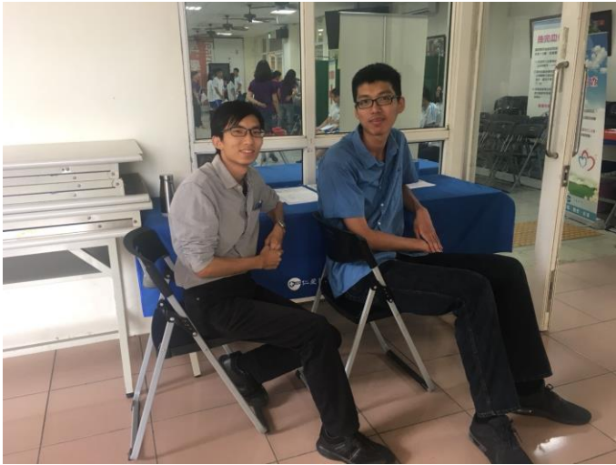
左圖：協助衛生組辦理高一新生健檢。