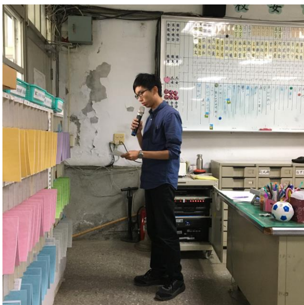
左圖：協助處室進行校園廣播。

除了衛生組之外，我也曾協助社團組的各社團資料彙整與整理，以及發放社團位置圖與各班同學參與社團名單給各班導師。由於原先駐校之教育替代役退伍，因此許多學務處的事務，也交由實習老師們來協助。我率先嘗試校園廣播這項任務，也對校內廣播系統有些許了解，在廣播系統出現問題時，也能夠及時提供基本的障礙排除。