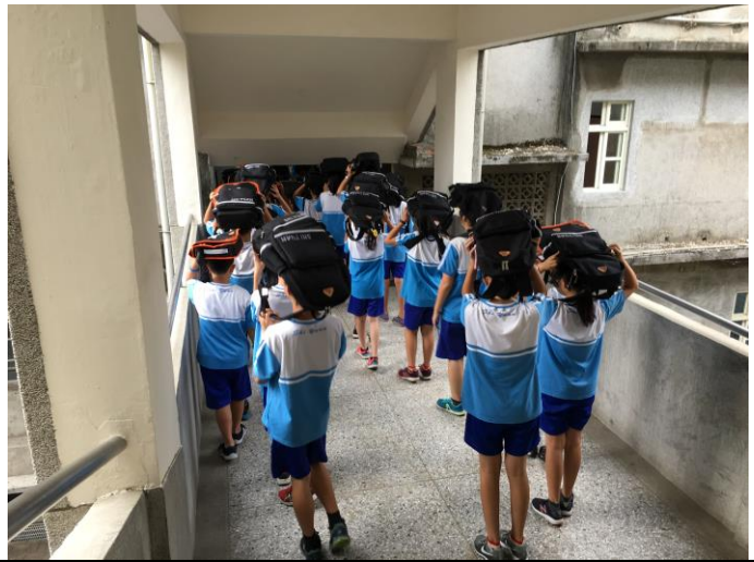
右圖：國家防災日演練。