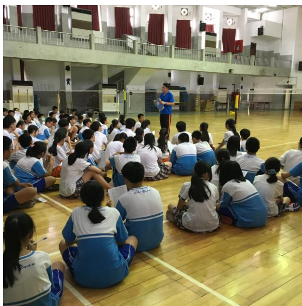
右圖：環保股長與服務股長幹部訓練。