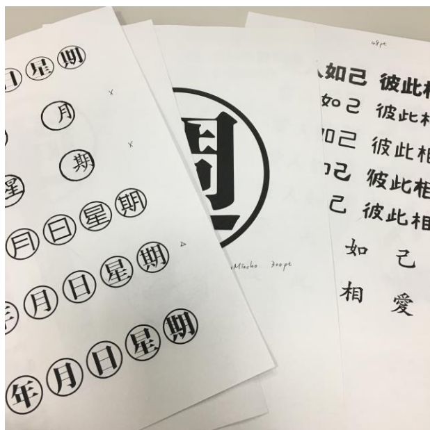
右圖：正式製作班級標語之前，將各種方案呈現，與班導師討論與決定的草圖。

由於開學後不久，就是班級布置的競賽，因此同學們也組成了小組來分工合作，同時，班導師也請我來協助標語製作的部分，如選字型、列印護貝等工作。我本身對平面设计有相當的興趣與實務經驗，因此我樂意將自身專長運用在班級布置工作上，並與班導師討論相關的點子，共同將美感帶進同學們的日常生活。