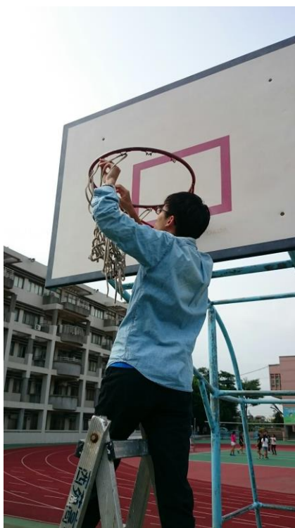
最左圖：協助衛生組發放各外掃區或各班掃具。