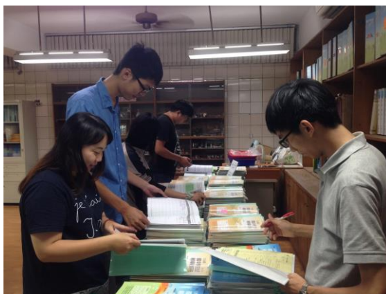
右圖：協助輔導處學生資料夾檢查。

我主要協助衛生組相關事務，在開學前需要處理如安排外掃區、各班掃具採購與分配等事宜。但開學前各處室皆需要實習夥伴的協助，因此我也曾從旁協助輔導處的學生資料夾資料檢查、學務處體育組更換籃球架籃網等工作。