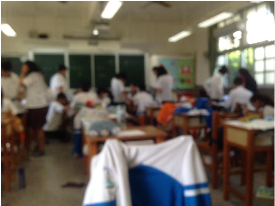
圖三、公民教育課程觀察：小組協力解題(照片經模糊處理)