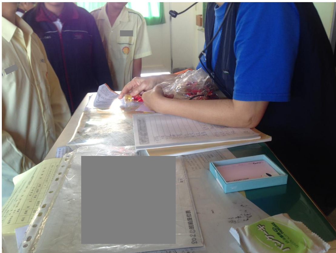
圖二、品格教育課程觀察：學生回答問題，用糖果作為獎勵