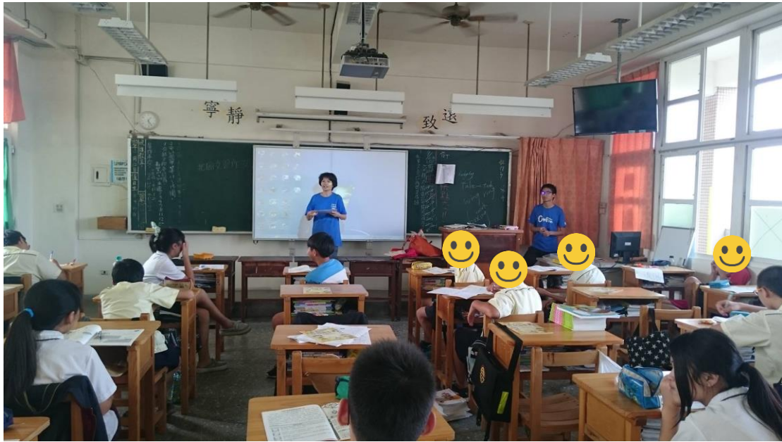
圖一、品格教育課程觀察(身穿藍衣站立者，左為志工媽媽，右為筆者)